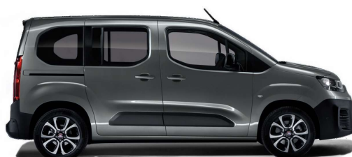
Šedá Platinum (691)