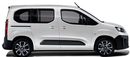
Bílá pastelová (549)