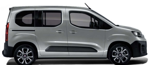
Šedá Artense (113)