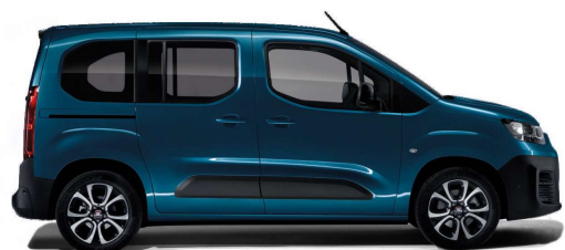
Modrá Mediterraneo (471)